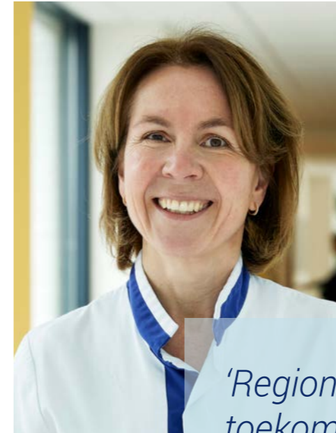
Voorzitter Vereniging Medische Staf (VMS)