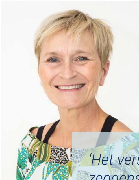
Voorzitter Verpleegkundig Stafbestuur (VSB)